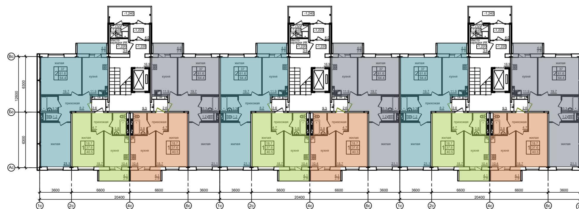
План типового этажа (дом №3)

Общая площадь квартир 6923,4 м 2 Площадь квартир 6547,2 м 2 Жилая площадь квартир 3676,2 м 2 Площадь жилого здания 8275,8 м 2 Строительный объем: 31314,6 м 3 Площадь застройки 955,2 м 2 Число квартир: -132. однокомнатные - 66кв. двухкомнатные - 66кв.