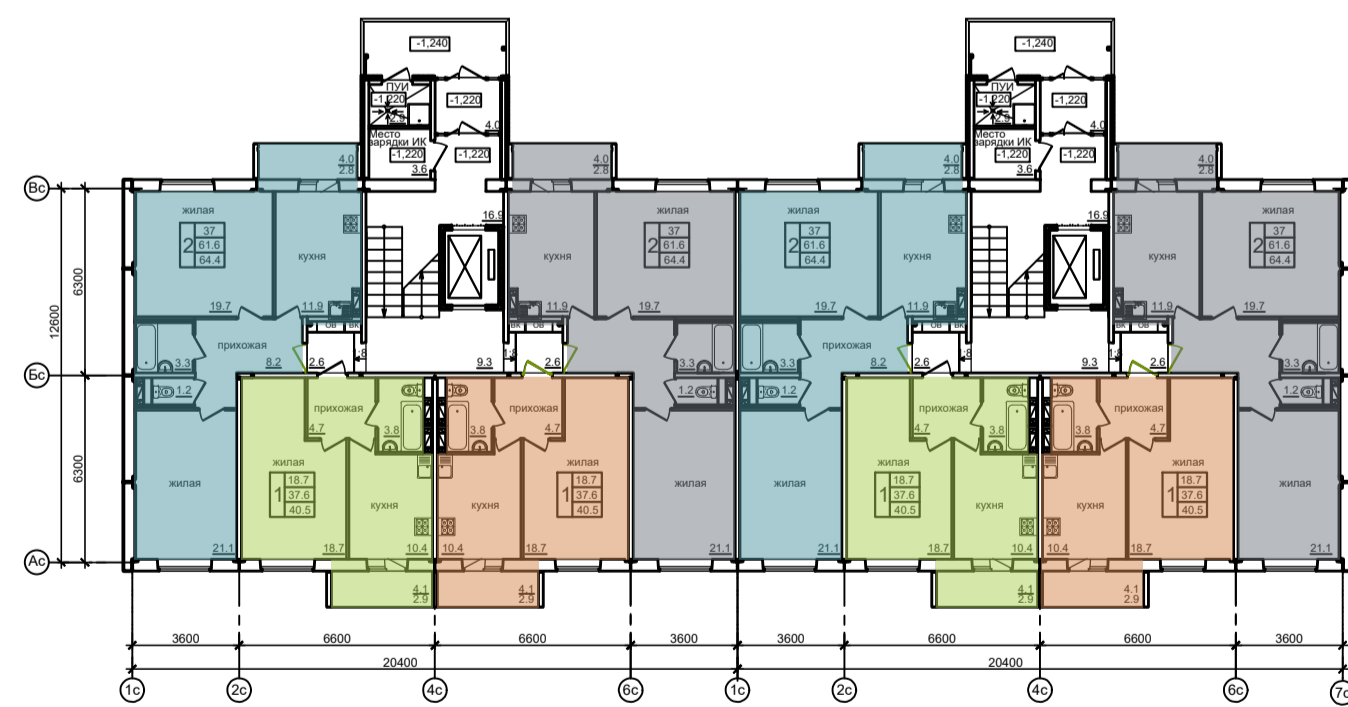
План типового этажа (дом №2)

Общая площадь квартир 4615,6 м 2 Площадь квартир 4364,8 м 2 Жилая площадь квартир 2450,8 м 2 Площадь жилого здания 2758,6 м 2 Строительный объем: 20876,4 м 3 Площадь застройки 636,8 м 2 Число квартир: -88. однокомнатные - 44кв. двухкомнатные - 44кв.