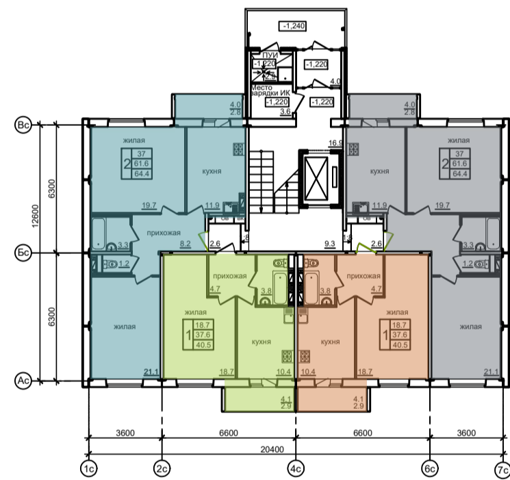
План типового этажа (дом №1)

Общая площадь квартир 2307,8 м 2 Площадь квартир 2182,4 м 2 Жилая площадь квартир 1225,4 м 2 Площадь жилого здания 2758,6 м 2 Строительный объем: 10438,2 м 3 Площадь застройки 318,4 м 2 Число квартир: -44. однокомнатные - 22кв. двухкомнатные - 22кв.